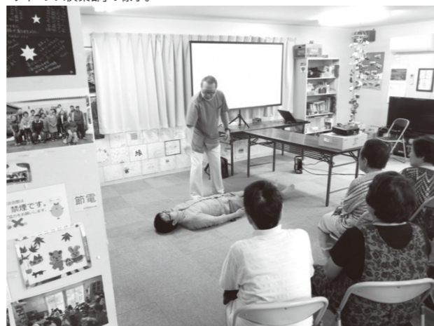
「クイーンズ倶楽部」の様子。

ような段階に至っていますことは、本当にうれしいことです。60歳～80歳の方々が、自分の親の介護を看ている、といった、所謂「老老介護」の方々が、仮設住宅に、たくさんおられます。この方々にとって、「あの日」から、もうすぐ5年となります。仮設の狭い部屋で、足が弱って行く人がいます。