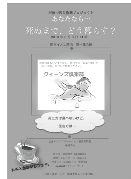
「クイーンズ倶楽部カフェ」のチラシ

何年も積み重ねた日常の中で、つい、健康について間違えた実践をしてしまう…そうした問題を自覚して、「生活習慣の改善見直し」が進みます。「集会所ならではの公共性」が、そこに活かされます。その背景にあるのは、良い情報伝達による環境の整備です。そうして次第に、積極的な変化が、住民の生活の中に生まれています。