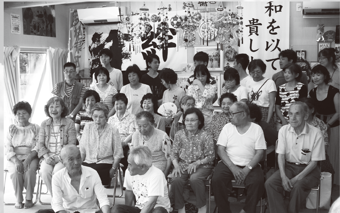
2015年7月13日 いわき市内の檜葉林城仮設での集会。20数名が集まって下さいました。

以上の働きは、結局、取り残されたと感じる人々の傍らに足を運び、その人々に「ともだちになっていただく」ことだったのだ、と気づきます。とにかく足を運び、「そこにいる」ようにすること。受け入れてもらえたら、そのまま、その苦しみの現場に「共にいさせて頂く」こと。そうやって、教会がそこにあり、キリスト者がそこにいるので、被災された方々が、その「ともだち」