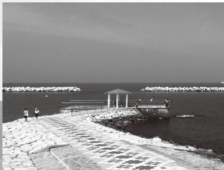
福島県相馬市(原発事故現場から約45キロ)の海岸の様子。

岩手でも、宮城県北部でも、沿岸部は、公共事業の喧騒の中にあります。しかしその事業は、決して、被災者の歓迎するもの