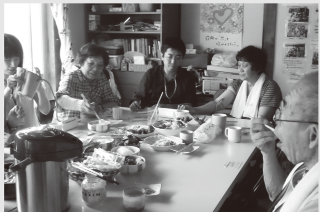
若林区の保健師さんが、月1回、血圧測定や健康の講話のために訪問して下さいます。

最初の事務所は、被災者ご自身のアパートでした。人数が増えてきたので、あるNPOの事務所をお借りしました。その後、また