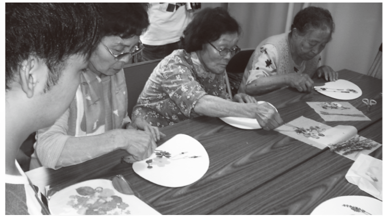
押し花教室の様子。花の香りの団扇を作成中。

になってくださる。すると、不思議なことに、世間が無視し忘れるよう努力している(と感じられてならない)現場の方々の尊厳が、回復する。そんな奇跡を、私たちは、2011年以来、ずっと、目にしてきたのではないかと。